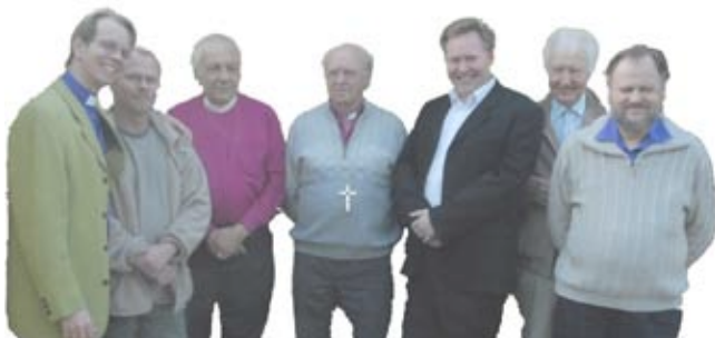
Den danske præstesynode:

Redaktionen kan allerede nu meddele, at der i næste nummer af Sanctus vil blive bragt et fyldestgørende takkeskrift og beskrivelse af biskop Kais mangeårige esoteriske virke.